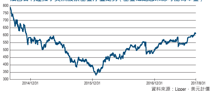
法巴百利達拉丁美洲股票基金淨值走勢 (基金之配息來源可能為本金)